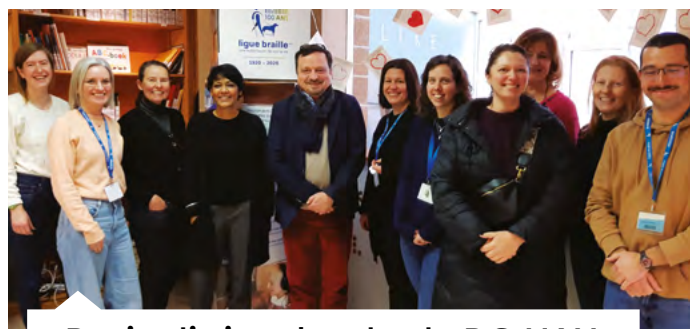
Begin dit jaar bracht de DG HAN een bezoek aan de Brailleliga

Meer informatie vind je op de nieuwe website: www.handicap.belgium.be waar je je ook kan inschrijven voor de nieuwsbrief. Of neem contact op via het gratis nummer 0800 98 799 (elke werkdag van 8.30 tot 12.30 uur); via het contactformulier (beschikbaar op de website); per brief (Kruidtuinlaan 50, bus 150 in 1000 Brussel), of tijdens een van de ongeveer 150 zitdagen per maand van de maatschappelijk assistenten van de DG HAN (de lijst staat op de website).